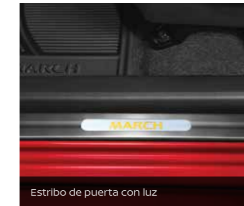
Estribo de puerta con luz