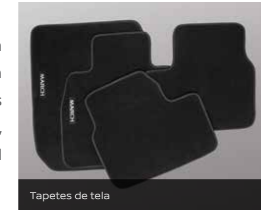
Tapetes de tela

Personaliza tu March con el estilo que decidas, con la mejor línea de accesorios que Nissan tiene para ti, dándole un toque especial hecho a tu manera.