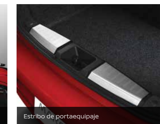
Estribo de portaequipaje

Características y especificaciones sujetas a cambios dependiendo de los requerimientos del mercado. Por favor consulta a tu distribuidor local.