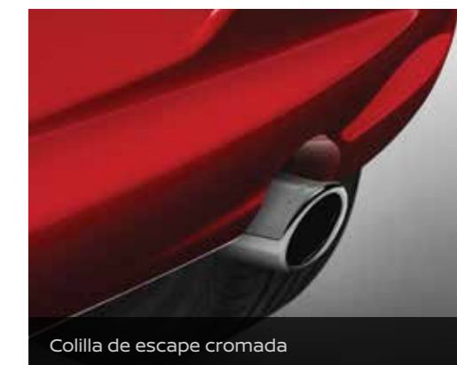
Collilla de escape cromada