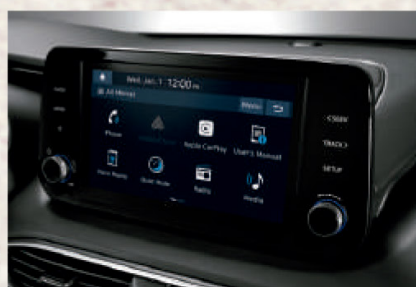
Radio touch de 10.25" con Android Auto™ y Apple CarPlay®