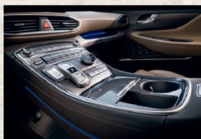
Selector de cambios con botones E-SBW