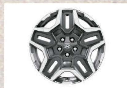
Aros de aleación de 19"